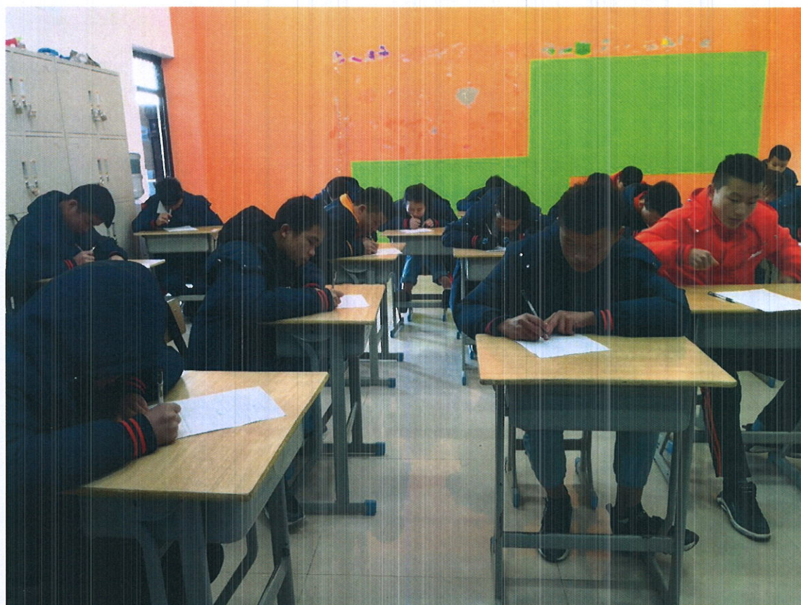
2018 级民族音乐与舞蹈班的同学在“隆善”冠名班里学习