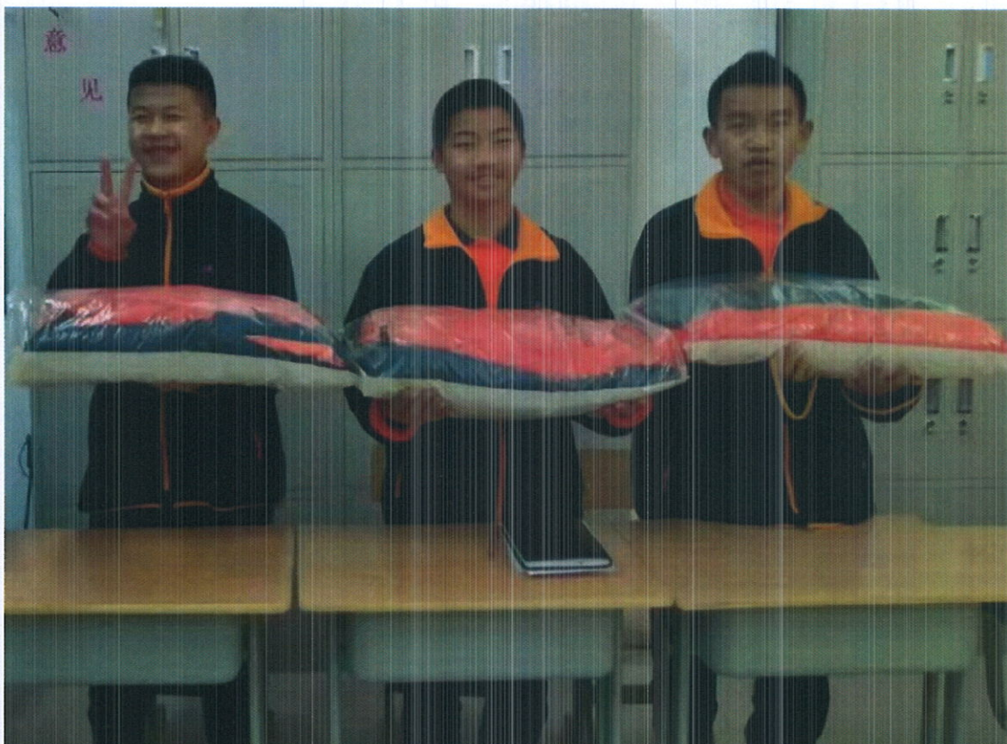
“隆善”项目资助 2018 级民族音乐与舞蹈专业学生校服