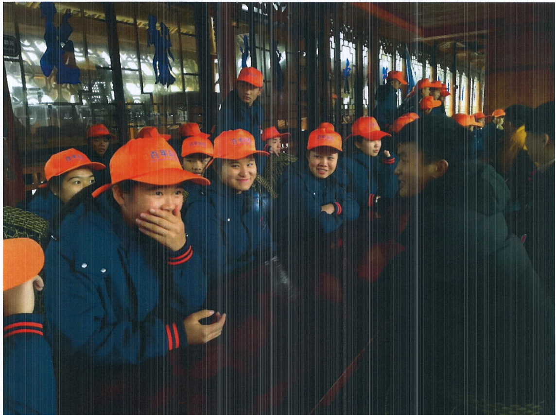
2018级民族音乐与舞蹈班的同学到艺术团学习交流