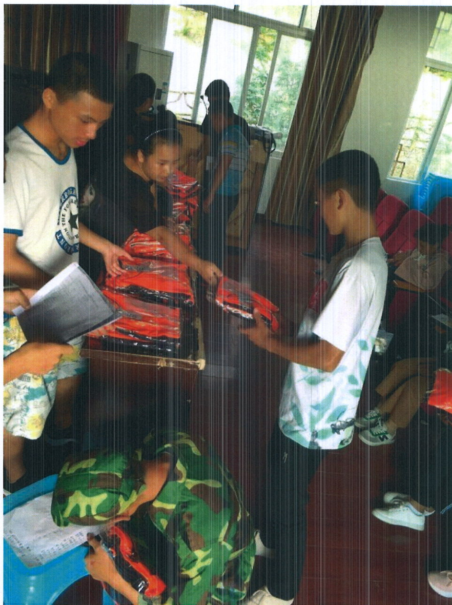
“隆善”项目资助 2018 级民族音乐与舞蹈专业学生校服