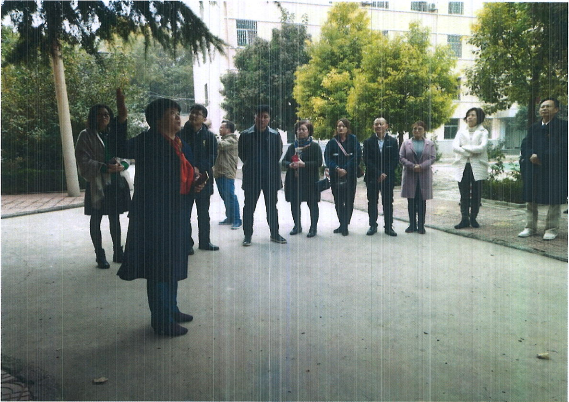
教师团队参加学生管理工作培训