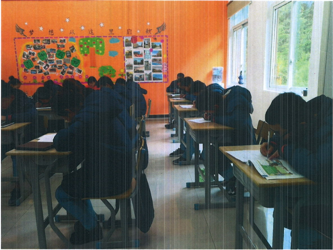
2018级民族音乐与舞蹈班同学在“隆善”冠名班里学习