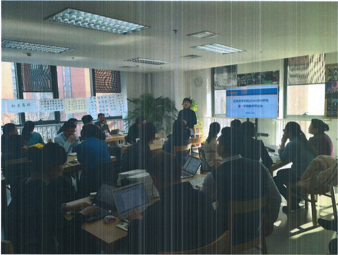
管理团队参加 2018--2019 学年中期管理评审会