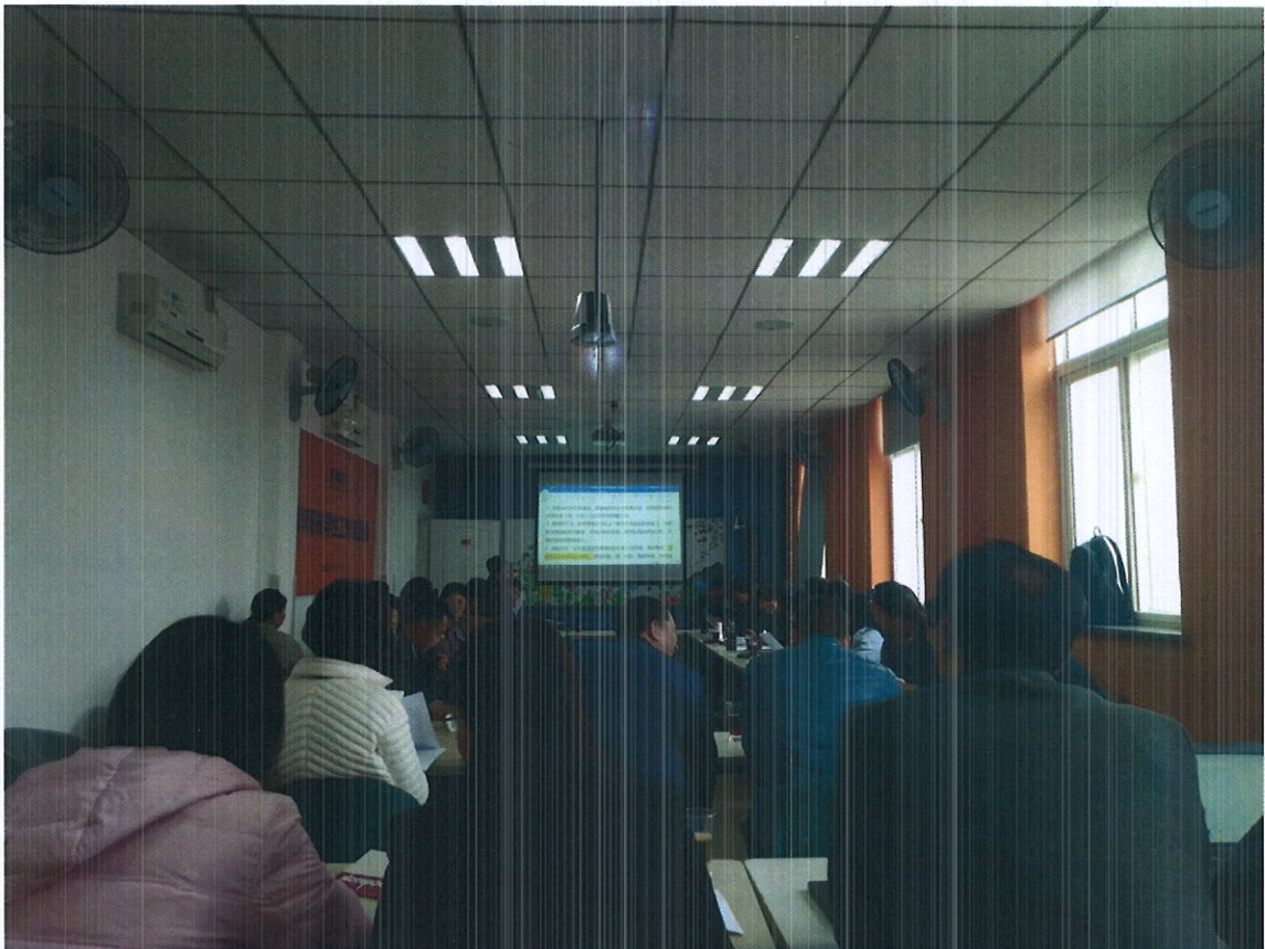
教师团队参加学生管理工作培训