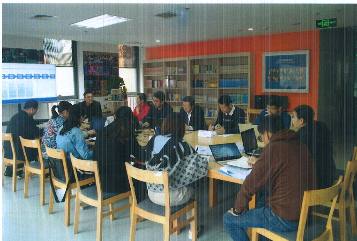
教师团队参加行政管理培训