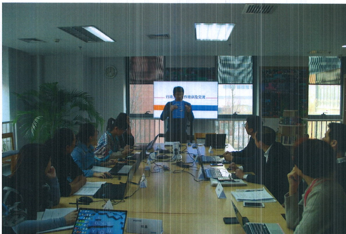
教师团队参加行政管理培训