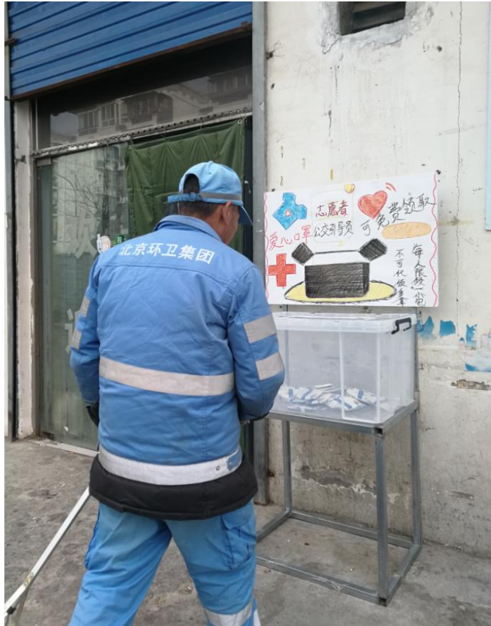
【瑞祥中街—环卫工人免费领取爱心口罩】