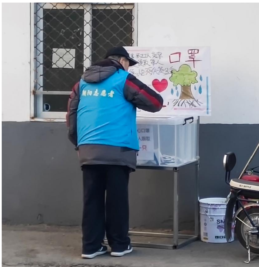
【管庄西里-志愿者免费领取爱心口罩】