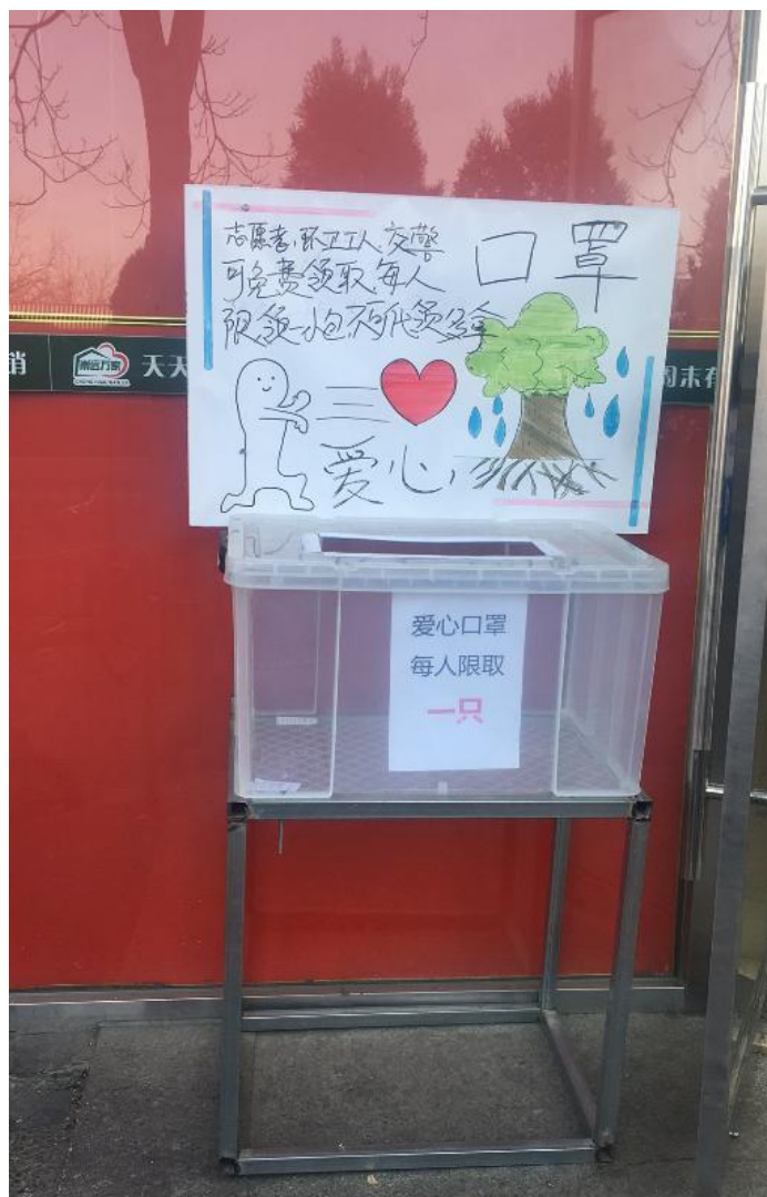
【无人看管“爱心口罩柜”】