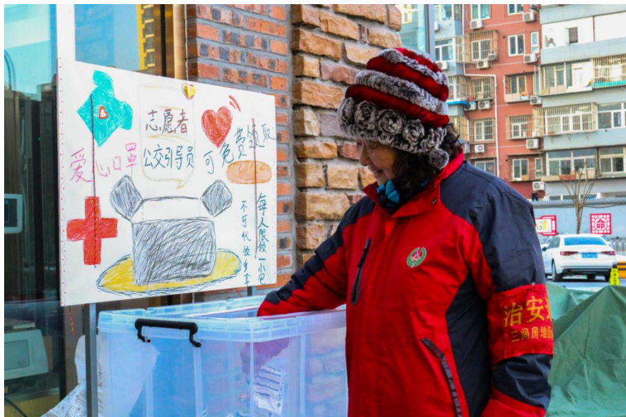
【双桥社区—志愿者免费领取爱心口罩】