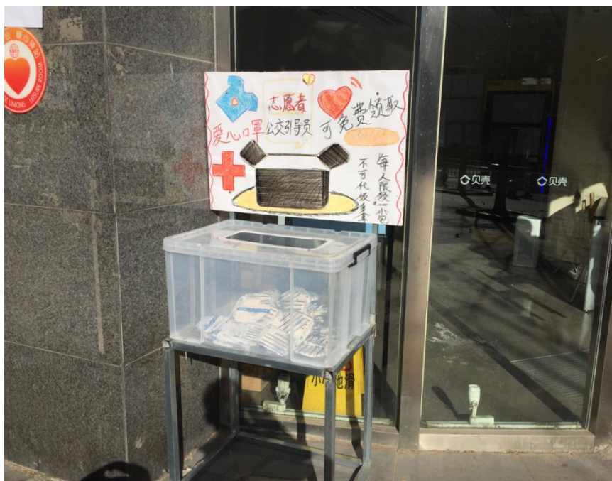
【口罩柜手绘宣传板】