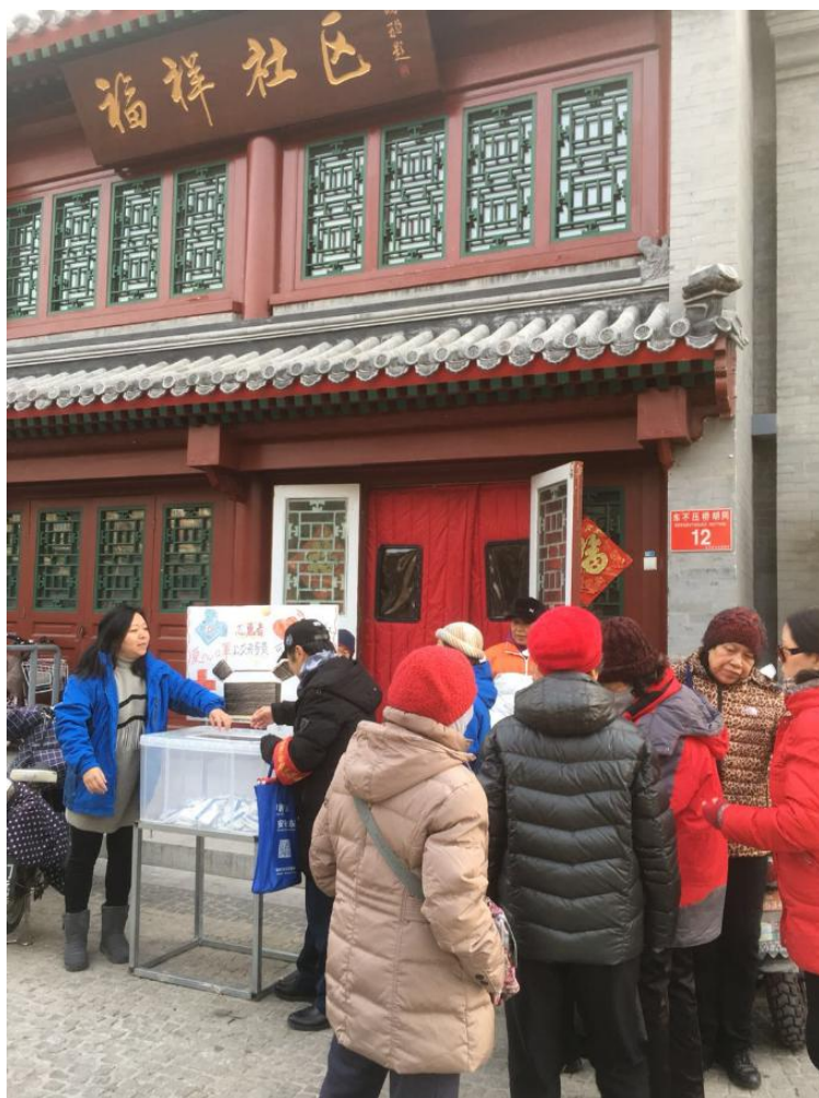
【福祥社区——志愿者免费领取爱心口罩】